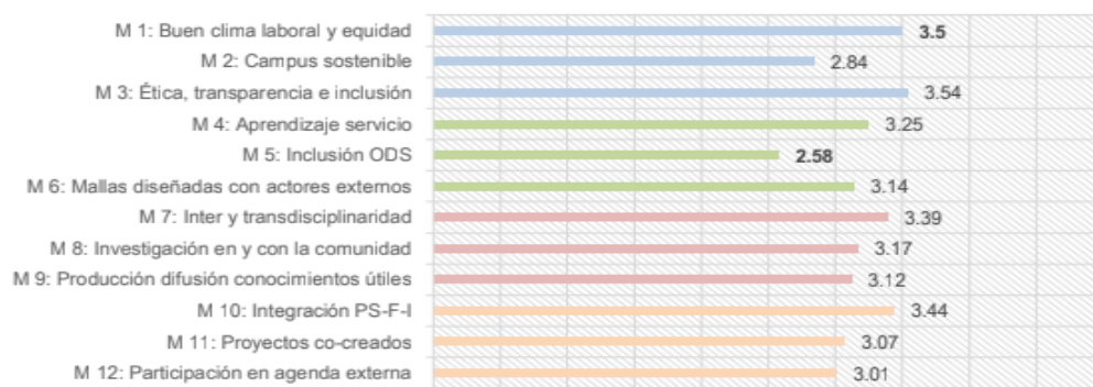
Gráfico No. 2 Puntaje promedio por cada Meta de RSU en América Latina - 2019

Lo que nos permite observar que el puntaje más bajo a nivel latinoamericano es la “Inclusión de los ODS en la formación”. Por su parte, el puntaje más alto ha sido otorgado al aspecto denominado “Ética, transparencia e inclusión”.